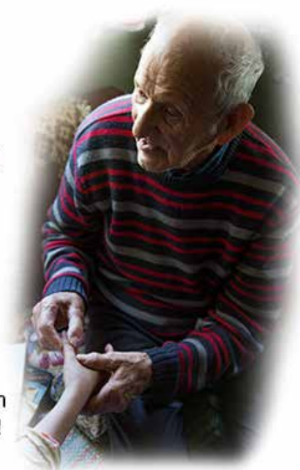
Reponedor de huesos XI Región.

Ayúdanos a continuar con nuestro trabajo y rescate!